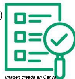
Imagen creada en Canva